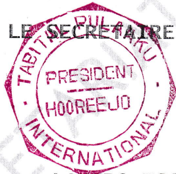
LAMIDO ISSA BI AMADOU